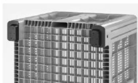
Опция перфорированного дна и стенок