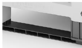
Усиленная конфигурация полозьев